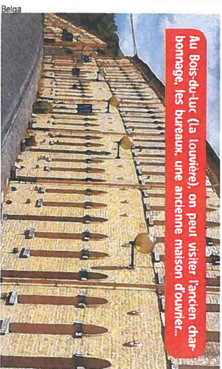
Au Bois-du-Luc (la Louvière), on peut visiter l'ancien charbonnage, les bureaux, une ancienne maison d'ouvrier...