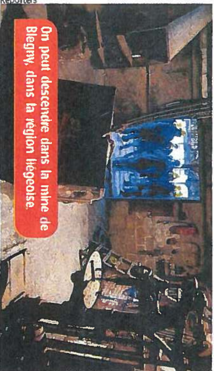
On peut descendre dans la mine de Blegny, dans la région liégeoise.