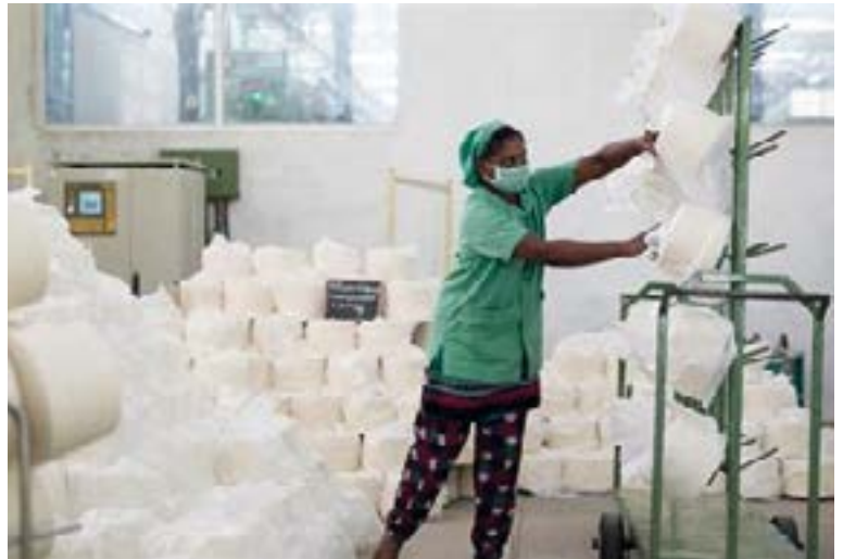
Extrait du film « La vie d'une petite culotte et de celles qui la fabriquent »